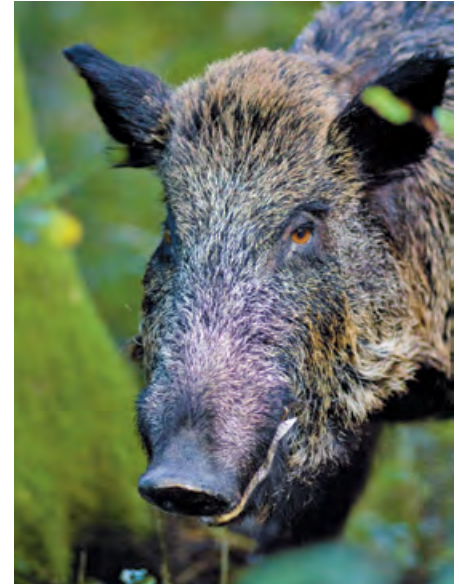
Kalle, das «zahme» Wildschwein.