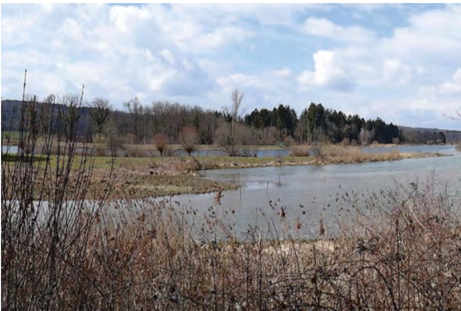
Der Flachsee bietet vielen Vogelarten Lebensraum.

Die nun abgeschlossenen Kartierungen in den verschiedenen Kilometerquadraten brachten viele spannende Beobachtungen, und nebenbei konnte ich auch noch schöne Bilder «mitnehmen». Wie etwa dasjenige des Sumpfrohrsängers an der Stillen Reuss, der bei einem der Kartierungs-Rundgänge keine 10 Meter vom Weg entfernt im lockeren Schilfbestand aus voller Kehle sang – da musste ich einfach das Kartieren kurz unterbrechen und den Sänger fotografieren.