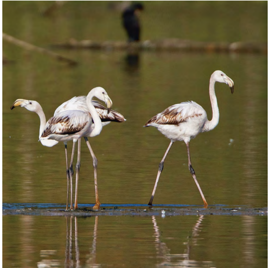
Rosaflamingos verliehen dem Flachsee im Sommer 2011 einen «Hauch von Camargue».

Es wird schon seit längerem beobachtet, dass südliche Arten immer häufiger über die Alpen nach Norden vordringen. Das