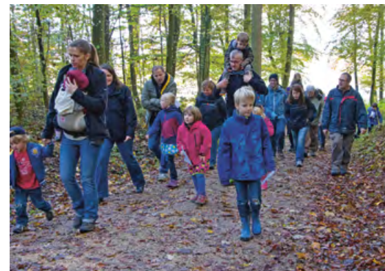
Gemeinsamer Rundgang auf den Spuren der Wildschweine.