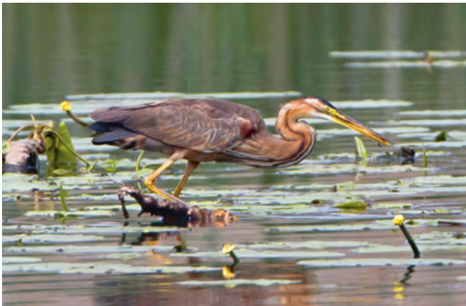
Begegnungen an der Stillen Reuss: Ein Purpurreiher lauert auf Beute...