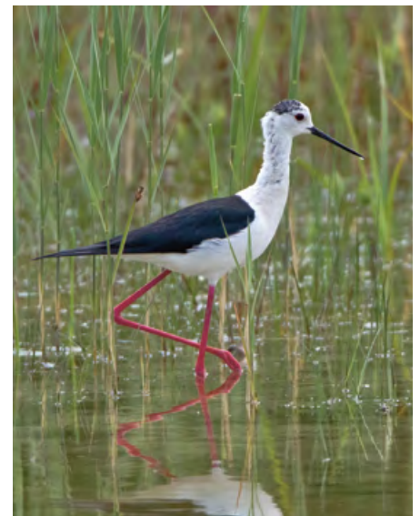
Stelzenläufer, hier im Gebiet Studweid, machten 2013 mit dem ersten Schweizer Brutversuch von sich reden.

lässt sich allgemein mit der Klimaerwärmung resp. mit der Verschiebung der gemässigten Klimazone nach Norden erklären. Auch der Flachsee wurde im Mai 2013 zum Schauplatz des ersten Brutversuchs einer vorwiegend mediterranen Brutvogelart – des Stelzenläufers. Zwar brüten diese hochbeinigen Limikolen auch weiter nördlich in Frankreich und den Niederlanden, doch in der Schweiz hatte es bisher noch keiner versucht. Nachdem sich ab dem 15. Mai 2013 gleich zwei Stelzenläufer-Paare abwechselnd am Flachsee und an der Stillen Reuss aufhielten, mehrten sich die Meldungen in ornitho.ch über Balzverhalten und Kopulationsversuche. Schliesslich gelang zwei Ornithologen am 30. Mai der definitive Brutnachweis – sie entdeckten ein Gelege in einer Mulde im Sand knapp über dem Wasser-