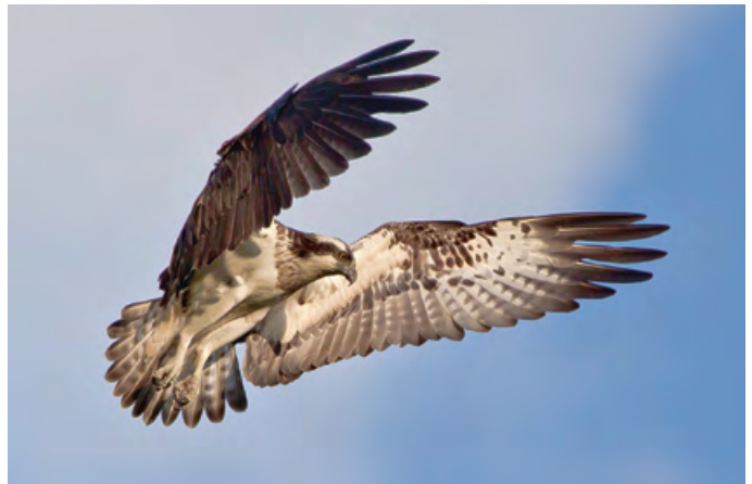
...und ein Fischadler sucht die Wasseroberfläche rüttelnd nach Fischbeute ab.